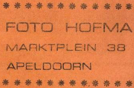
FOTO HOFMA MARKTPLEIN 38 APELDOORN

VOOR DE JUISTE ZET OP FOTO- EN FILM GEBIED